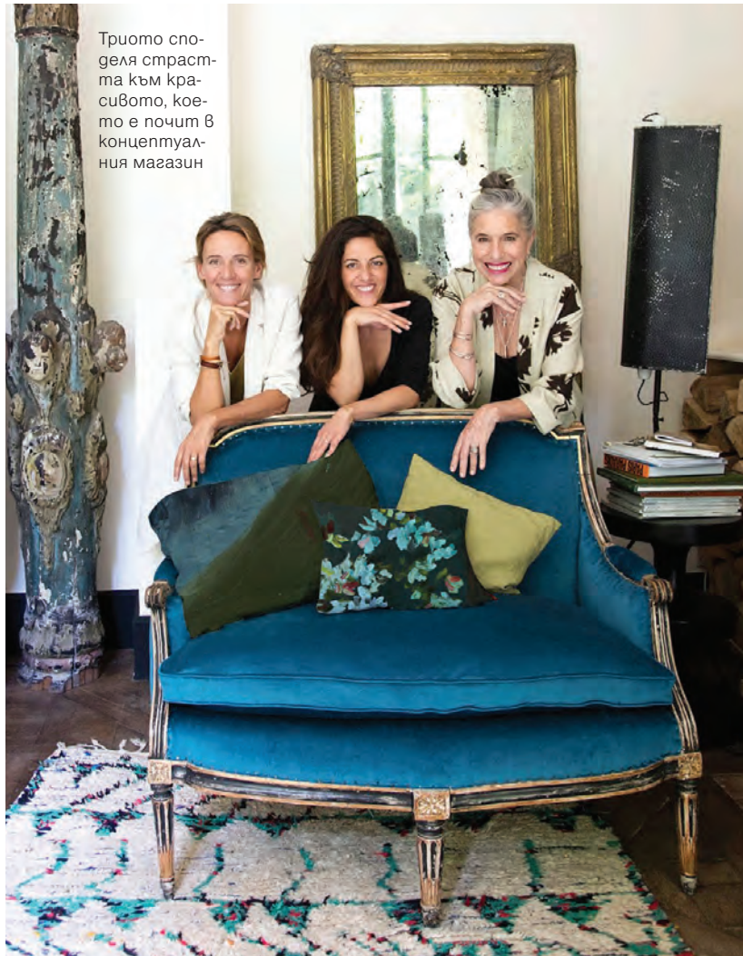
Триото споделя страстта към красивото, което е почит в концептуалния магазин